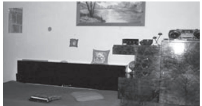
Ideiglenes lakásbeli szoba