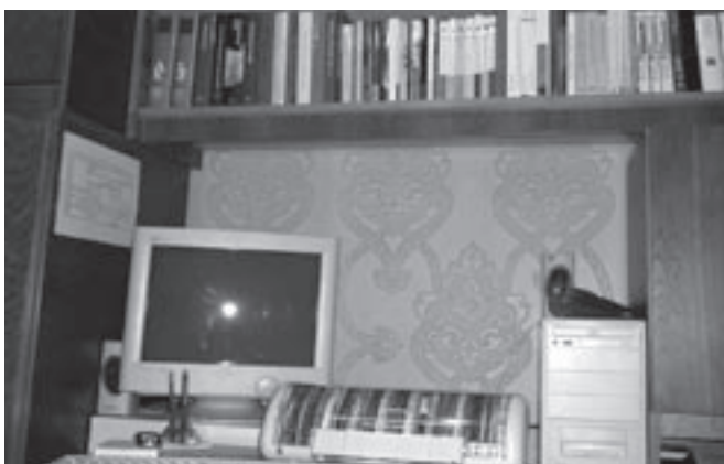
Átmeneti otthon „felszereltsége”