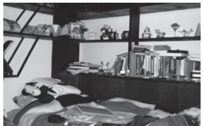
Egy „otthon”-i szobarészlet