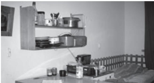
Szállás-típusú szoba egy Haşdeu-s bentlakásban